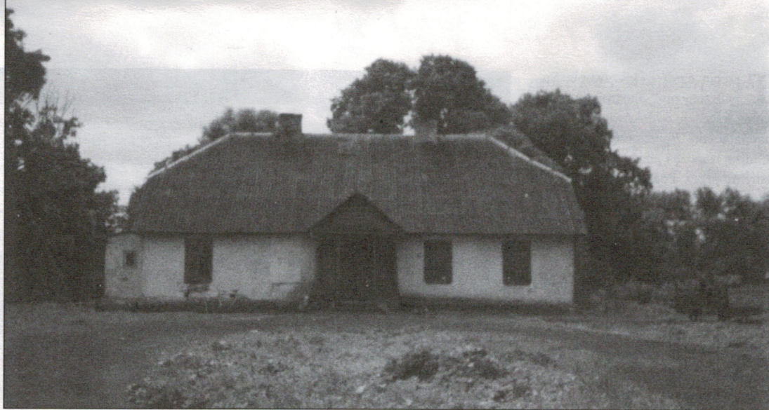
Oficyna dworska od północy, 1995 r.